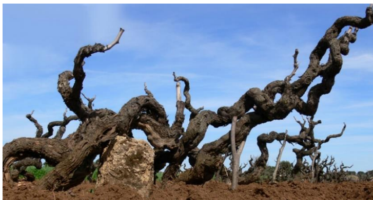
Alte Primitivo Rebstöcke in Apulien